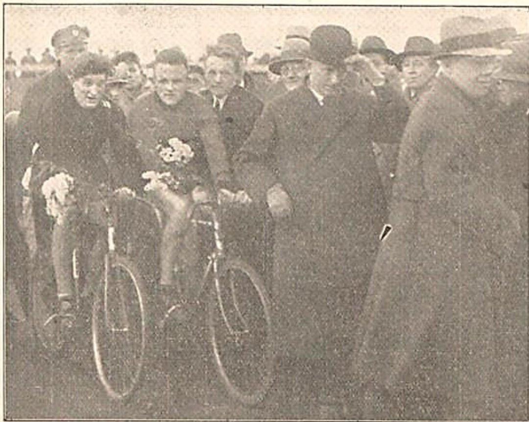
De voorzitter van Waalwijks Belang heeft zoo juist bloemen uitgereikt aan de winnaars. (Reijnders—Slaats) van den grooten koppelwedstrijd op de pas geopende Waalwijksche Wielerbahn.

Daarna volgen er tal van wedstrijden op de Waalwijkse zandbaan.