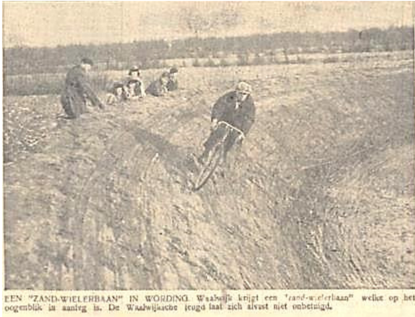
EEN "ZAND-WIELERBAAN" IN WORDING. Waalwijk krijgt een "sand-wielerbaan" welke op het oogeblik in aanleg is. De Waalwijkse jeugd laat zich alvast niet onbetuigd.

De Waalwijkse Zandbaan in aanleg. De Waalwijkse jeugd probeerde het baantje alvast uit.