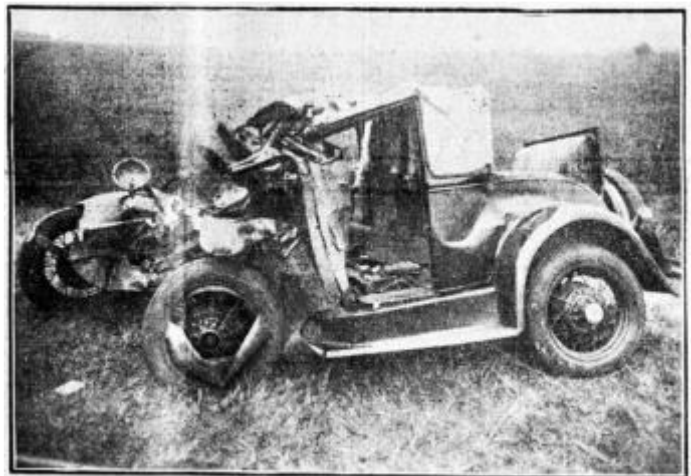
De volslagen vernielde Fordwagen, waarin de drie renners jammerlijk den dood vonden.