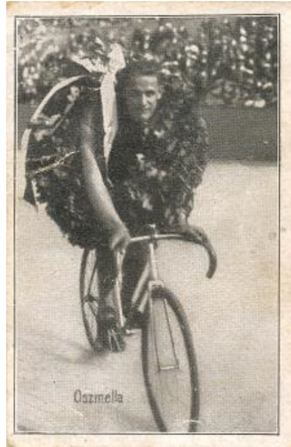
Paul Oszmella (1903 – 1967)

Was Belgisch uurrecordhouder in 1933 (43.684 km.) en werelduurrecordhouder achter tandems in 1934 met 54.345 km.