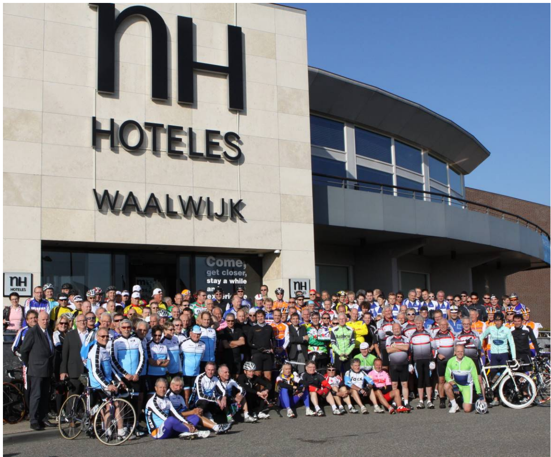
2010: Het hele peloton voor vertrek bij NH Hoteles in Waalwijk.