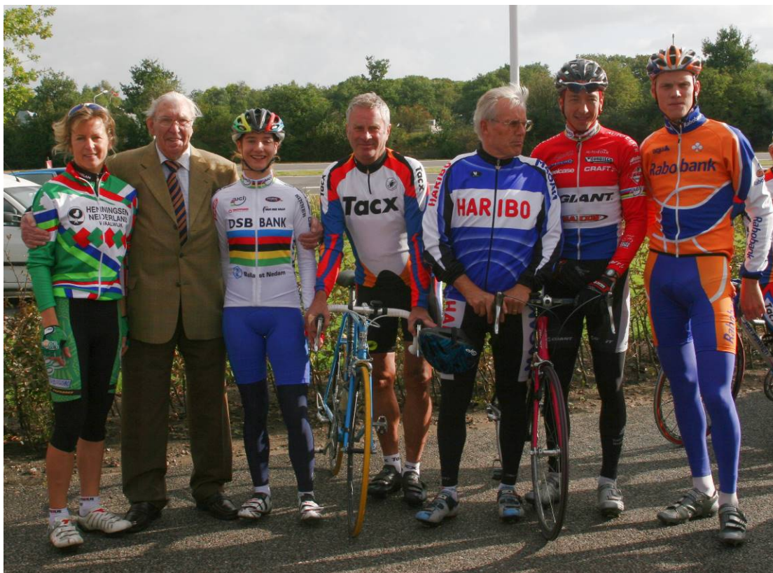
2006: Wereldkampioenen v.l.n.r. Alessandra Cappellotto, Henk Faanhof, Marianne Vos, Jaap Oudkerk, Jan Janssen, Bart Brentjens en Lars Boom.