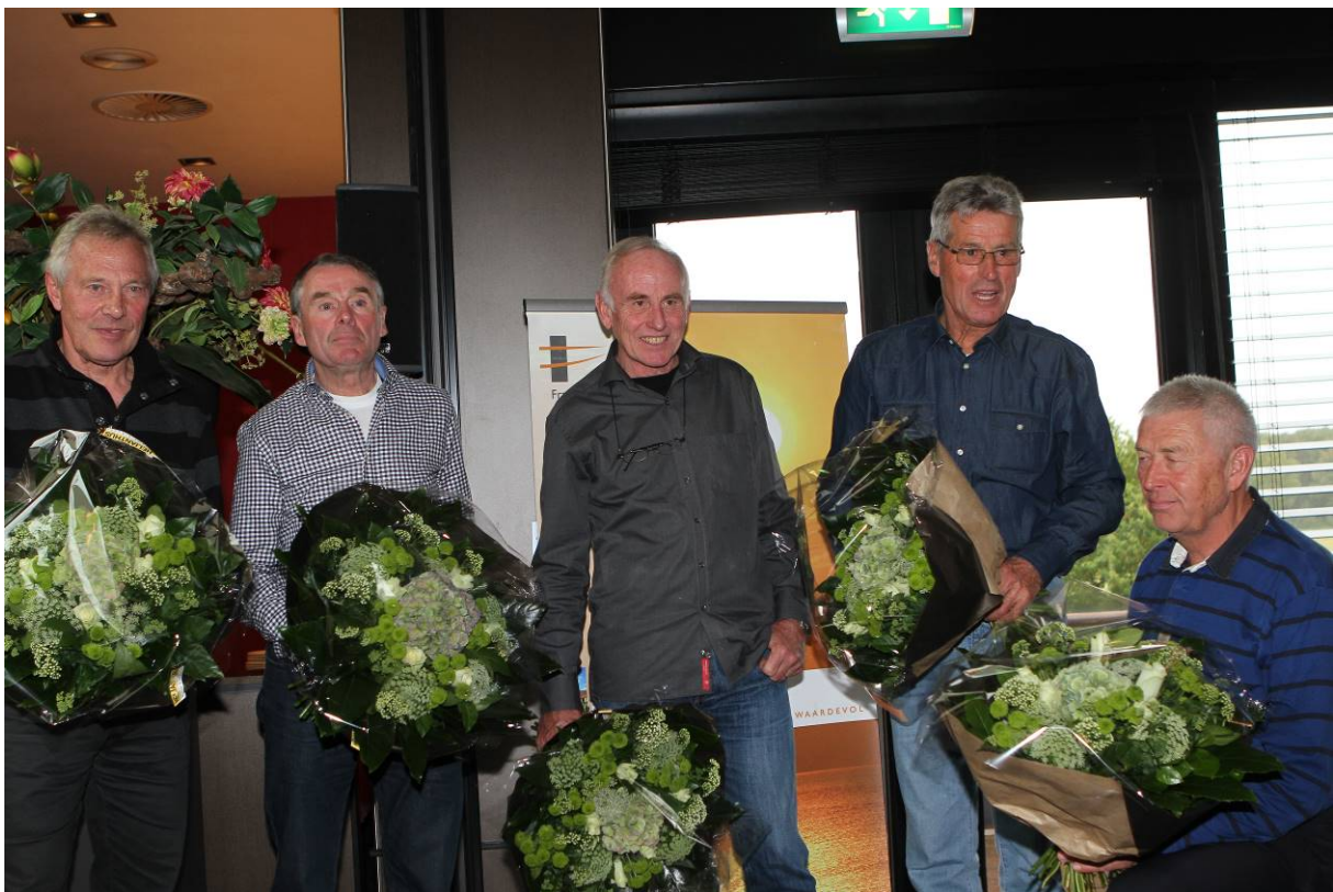
2012: Gouden Olympische medaille winnaars: v.l.n.r. Jan Krekels, Hennie Kuiper, Joop Zoetemelk, Jan Pieterse en Gerben Karstens.