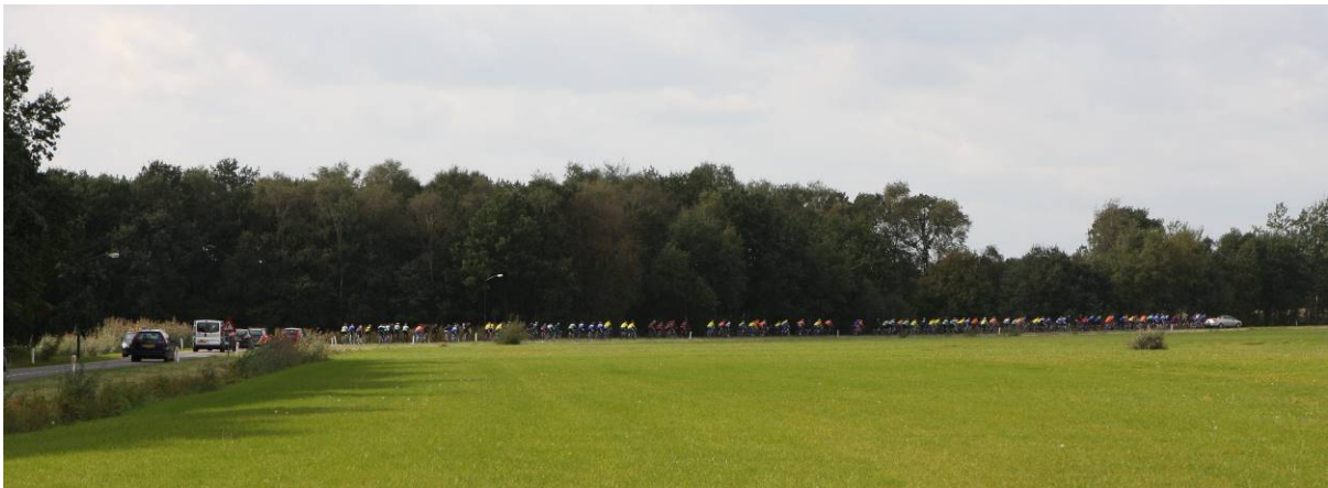
En de langgerekte stoet Midden-Brabant in trekt (2008).