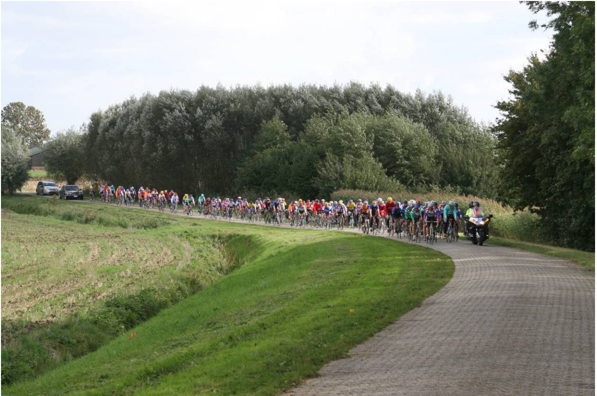
2006: Eén lange sliert door Midden-Brabant.