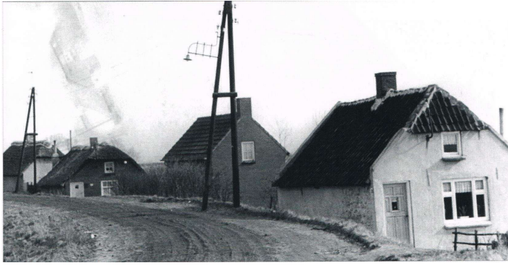
Woningen aan de Heidijk (no. 's 55 t/m 59), omstreeks 1950. Hier passeerden de renners op weg naar de finish.