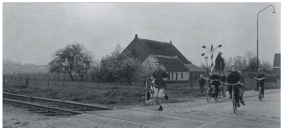
Spoorwegovergang in de Heistraat, omstreeks 1955. Een van de twee keer dat de renners per ronde de (onbewaakte !) Langstraatspoorlijn over moesten.

natuurlijk niet alleen beslissen. Hij zou ze over een half uurtje laten weten of ze mee mochten doen. Natuurlijk waren er geen jury en geen bestuur, de Sjok die fantaseerde maar wat, en die ging op zijn gemak een kopje koffie zitten drinken, kwam na een half uur weer naar